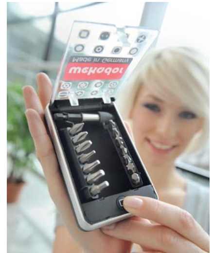
Bei Bits und anderen Kleinteilen heißt es oft „Nur gucken, nicht anfassen!“

Geben Sie die Bittsteller-Bits frei! Legen Sie sie heraus und sorgen Sie dafür, dass immer nachgekauft wird, wenn welche fehlen. Natürlich steigt am Anfang der Verbrauch, weil Ihre Mitarbeiter bunkern. Genau wie die Oma nach dem Krieg, als sie sich das erste Waschmittel leisten konnte. Da konnte sie auch nicht genug bekommen – wer wusste schon, ob es morgen noch was gab. Wenn Ihre Mitarbeiter aber merken, dass es immer genug von dem