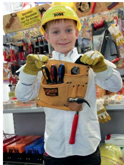
Für Werkzeug und Verbrauchsmaterial jedesmal zum Boss rennen? Kindisch!

Oder haben Sie schon mal in Ihrer Produktion nachgesehen, wo der Lackierer die Filter für die Spritzpistole versteckt hält? Oder der Meister die SDS-Bohrer? Wieso eigentlich? Noch nie hat jemand diese Frage schlüssig für Cent-Artikel beantworten können.